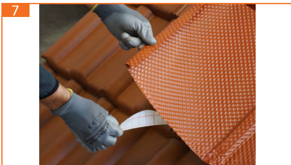
7. Schutzfolie des Butylklebestreifens abziehen