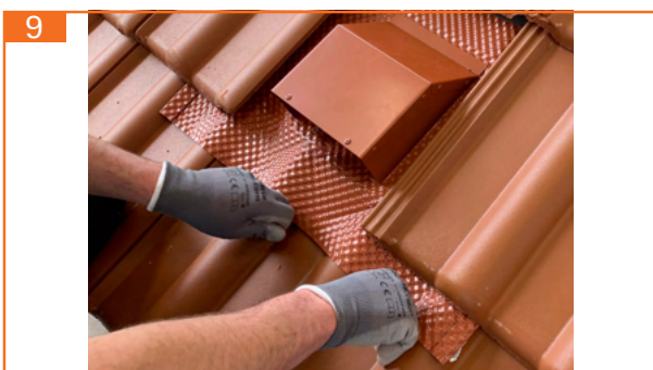
9. Dachhaube an Kontur des Ziegels mittig beginnend nach außen anformen und fest andrücken.