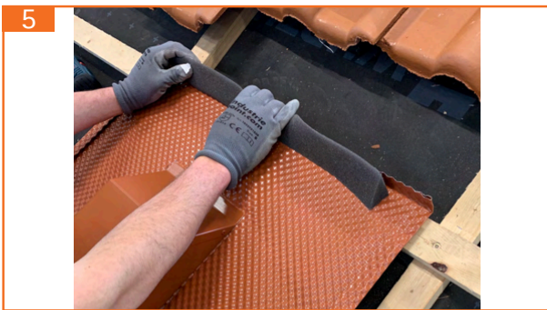
5. Schutzfolie des Kehldichtstreifens (500 mm) abziehen und auf der oberen Kante anbringen