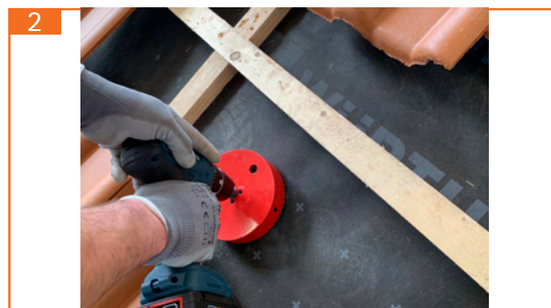
2. Öffnung >130 mm für die Schlauchdurchführung schaffen, auf spätere Ausrichtung achten