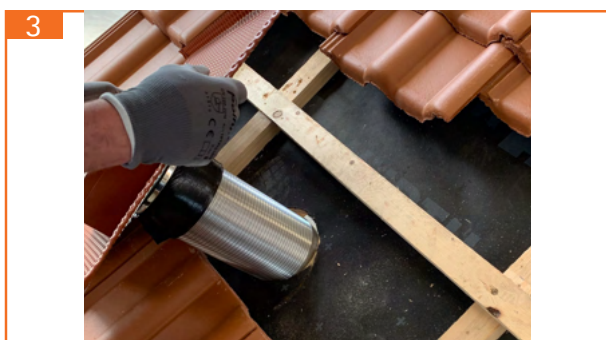
3. Lüftungsrohr fachgerecht anschließen Hinweis: bei Anschluss an DN100 muss ein Reduzierstück RS100125 separat bestellt werden.