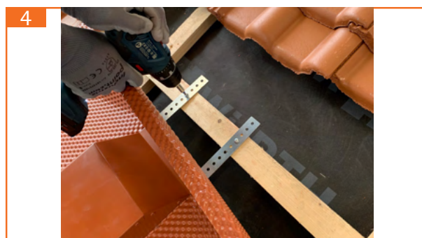
4. Dachhaube so ausrichten, dass die Metallplatte auf dem unteren Ziegel aufliegt, anschließend beide Streben an oberer Dachlatte verschrauben