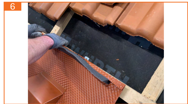
6. Obere Aluminiumaufkantung nach vorne einschlagen