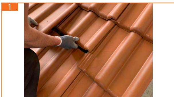
1. Öffnung herstellen, Dachziegel entfernen